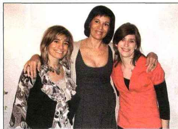
Un trio de charme...